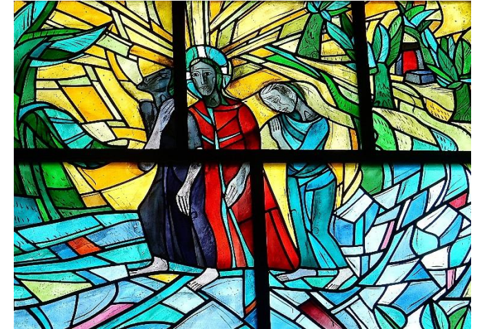
Bild: Friedbert Simon (Fotografie), Erich Schickling (künstlerischer Entwurf) In: Pfarrbriefservice.de

Liebe Mitchristen, „Das Grab ist leer...“. Wir feiern die heilige Woche und werden hineingenommen in das Geschehen von Tod und Auferstehung Jesu. In diesem Flyer finden Sie Informationen zu den Gottesdiensten von Palmsonntag bis Ostermontag! Herzliche Einladung zur Mitfeier der Kar- und Ostertage.